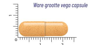
Ware grootte vega capsule

HUIJ VIT B VIT B12 VIT C VIT D VIT K MIN KLAAR AMINO GLUCO VETZ FYTO ANTI NEURO V & E COMPLEX PROBIO GREENS